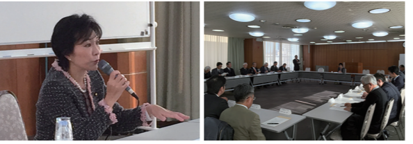
12/7 北大阪商工会議所 北大阪経済政策懇談会で講演(枚方市)