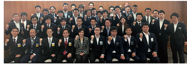
5/23 枚方青年会議所で講演(枚方市)