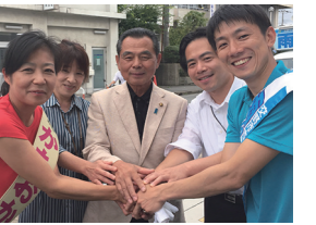
9/13 交野市議会議員選挙