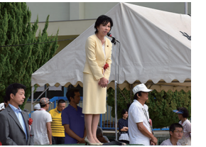
9/27 小倉校区区民体育祭(小倉小学校)