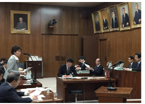
4/22 経済産業委員会 電気事業法等改正法案審議