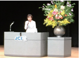
5/17 日本青年会議所第43回京都ブロック城陽大会で講演(城陽市)