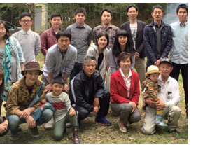
4/19 たけのこほりとBBQに参加(交野市)