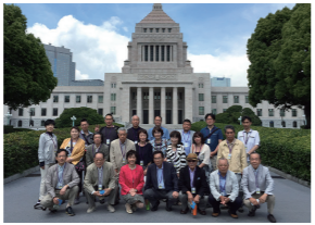
6/10 家具町商店街のみなさま国会見学