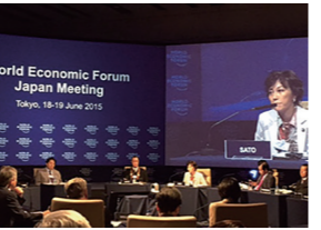
6/18 世界経済フォーラム「Japan Meeting」ウェルカムレセプション出席