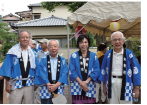
8/22 樟葉朝日夏祭り(金崎公園)