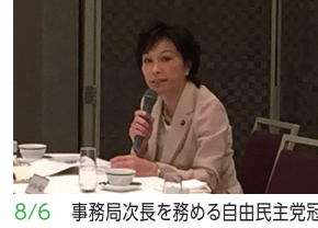
8/6 事務局次長を務める自由民主党冠婚葬祭互助会進行議議員連盟幹部と全日本冠婚葬祭互助会政治連盟との懇談会出席