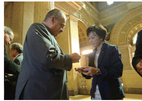
6/1 経産委 チェコ共和国下院外交委員長御一行表敬訪問懇親