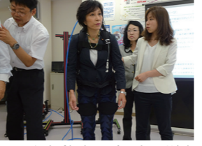
8/5 経産委視察 国立研究開発法人日本医療研究開発機構AMED(千代田区)