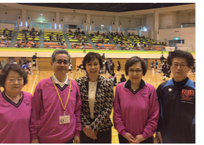
3/21 ソフトバレー大会開会ご挨拶(枚方総合体育館)