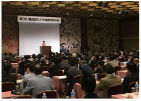
10/17 学校法人関西医科大学 連携病院の会で講演(大阪市)