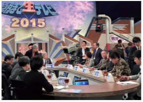
3/27 テレビ朝日「朝まで生テレビ」に出演