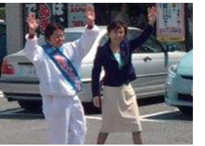
4/26 枚方市議会議員選挙