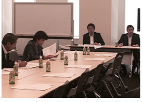
7/14 与党関西国際空港推進議連総会出席