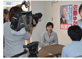
8/28 TV大阪「NewsリアルFRIDAY」に出演