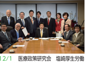
12/1 医療政策研究会 塩崎厚生労働大臣に対する平成28年度診療報酬改正及び税制改正大綱についての決議申入れ