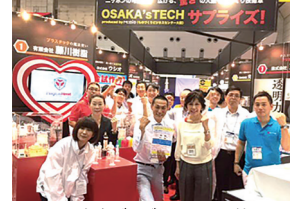
6/24 東京ビッグサイトにて第26回日本ものづくりワールド視察(江東区)