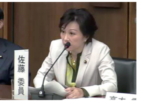
5/7 憲法審査会 我が国の国家像を提唱