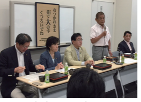
7/14 事務局長を務めるたみ振興議連総会開催