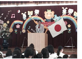
4/4 幼稚園入園式でお祝いのご挨拶(枚方市)