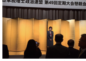
9/17 日本税理士政治連盟第49階定期大会懇親会ご挨拶