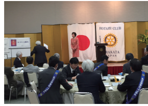
3/3 枚方ロータリークラブで講演(枚方市)