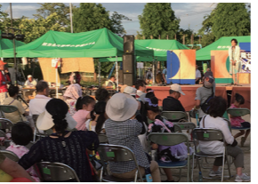
7/19 第4回香陽七夕けんぎゅう祭(香陽小学校)