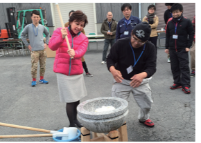
2/7 地元地元企業餅つき大会に参加(枚方市)