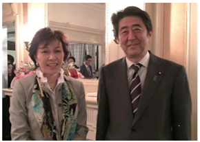
3/31 鳩山邦夫会長きさらぎ会にて安倍総理と懇親