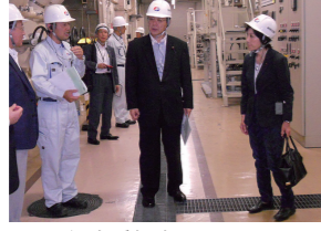
7/8 経産委視察 みなとみらい二十一熱供給株式会社(横浜市)