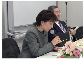
3/19・11/26 事務局を務める自民党フラワー産業議連総会開催