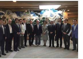
9/21 枚方・交野 病院懇談会