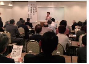
4/27 清話会で講演(大阪市)