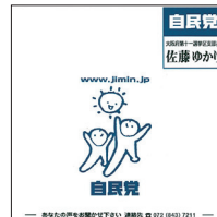
■ 広報板 / 2C 900mm×900mm

自民党大阪 11 区支部では、枚方市、交野市、にお住まいの方・お勤めの方で、自民党広報板または佐藤ゆかりの立看板を設置いただける箇所を募集しております。ご自宅や会社の外壁、空地、農地、駐車場フェンス等に、設置いただける方は、是非ともご連絡下さい。