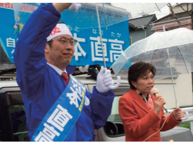
4/12 大阪府議会議員選挙

2015年大阪は大阪市特別区設置住民投票を含む7つの選挙が執行され、まさに「選挙の年」となりました。交野市選出府議、枚方市議4名、交野市議2名が当選。多大なるご支援を賜わりながらも、決して満足できない結果となりました。これを真摯に受け止め、改めて自民党改革、そして党勢拡大に励んで参ります。保守の力を今、自民党員そして我々自民党所属議員で力を合わせて確立させていく所存です。まずは、11選挙区内(枚方市・交野市)での党员獲得目標1000名を目指します。ご支援・ご協力よろしくお願ひします。*写真日付は投票開票日