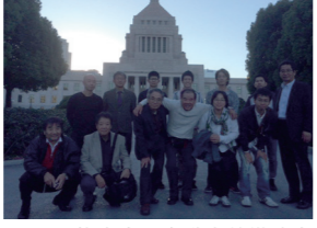
11/3 枚方交野自動車整備連合会のみなさま 国会見学