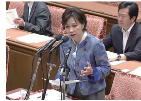
5/15 地方創生特別委員会 地方創生関連3法改正法案審議 質問