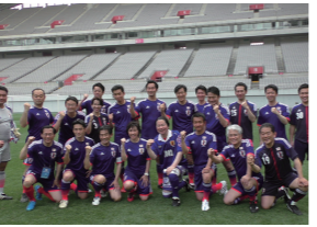
6/13 サッカー外交推進協議第8回日韓国会議員親善サッカー大会出場(ソウル市ワールドカップ競技場)