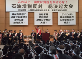
11/14 石油増税反対総決起大会のみなさま 国会見学