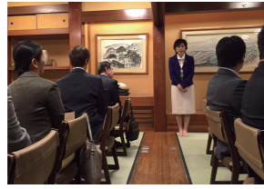
10/4 大阪柔道整復師連盟で講演(大阪市)