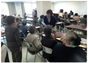
4/25 私部長寿会通常総会・懇親会に出席(私部会館)