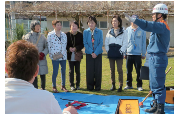
2017/2/26 香陽校区 自主防災訓練に参加 (枚方市)