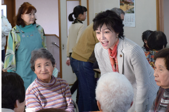
2016/12/3 出口ふれあいサロンにて懇親 (枚方市)