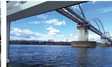
枚方市船着場～八軒屋浜船着場の2時間半舟運コース乗船 (枚方市～大阪市)