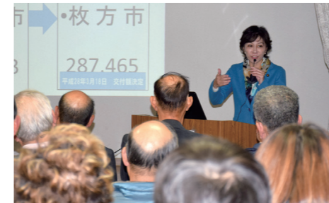
2016/11/20～ 枚方市・交野市各地にて国政報告会を順次開催 (枚方市・交野市)

地元大阪11区（枚方市・交野市）各地で、昨年11月から 佐藤ゆかり議員 が国政報告会を開催しています。2014年12月総選挙で大阪11区当選後この2年間、地域の遅れを取り戻し町を前進させるため、 佐藤ゆかり議員 が精力的に国につなぎ動き出したさまざまな案件について具体的に報告しています。昨年8月枚方市の牧野高槻線に決定した淀川渡架橋の建設決定に至るまでの国との細かい折衝や、今年3月改善工事が完了した第2京阪側道の307号線交差点や、その他渋滞箇所の解消策の推進、国の地方創生加速化交付金を使った大阪府の淀川舟運再開事業も、枚方の船着き場から枚方宿・五六市へと観光ルートをつなげる町づくりの検討に向けて、今年2月舟運試験運行への乗船を地域の皆様に呼びかけ、共に乗船視察を行っています。今後も多くの皆様に枚方・交野の各地国政報告会で「有言実行」 佐藤ゆかり議員 の報告をお聞き頂けますよう宜しくお願いいたします。