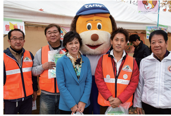
2016/11/26 織姫の里 交野市民まつり (交野市)