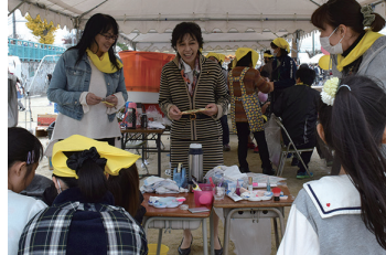
2016/12/4 第 26 回 楠葉南コミュニティ餅つき大会 (枚方市)