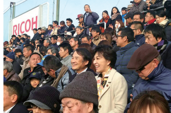
2017/1/7 全国高等学校ラグビー大会決勝東海大仰星(枚方) vs 東福岡激励戦 (東大阪花園ラグビー場)