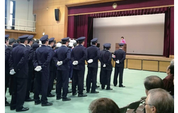
2017/1/8 H29 年交野市消防出初式 (交野市)