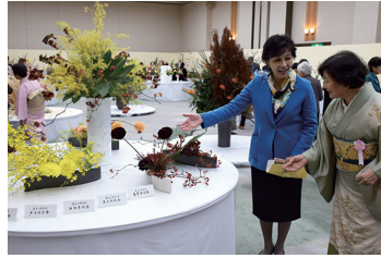
2016/11/26 枚方市茶華道協会 45 周年記念花展「花・・・愛ほしく」 (枚方市)