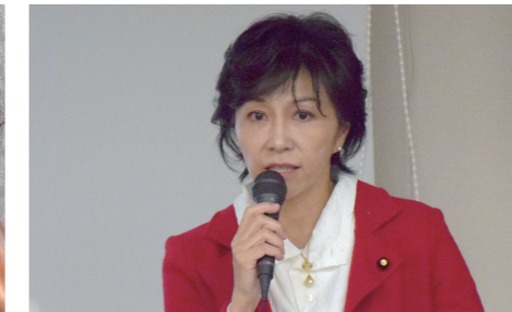
国政報告会での質疑応答に熱心に答える 佐藤ゆかり議員 (枚方市)