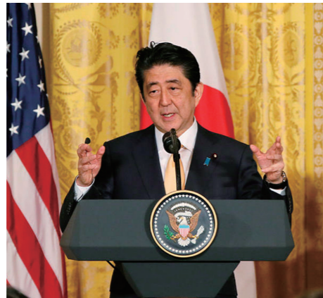
2017/2/10 日米共同記者会見に臨む安倍総理 出展：首相官邸ホームページ (http://www.kantei.go.jp/jp/97_abe/actions/201702/10usa.html)