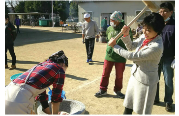
2016/12/3 伊加賀小学校 PTA 主催「伊加賀冬まつり」 (枚方市)