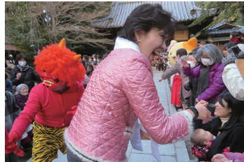
2017/2/3 交野天神社節分祭 (枚方市)