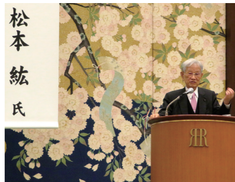
2017/3/16 理化学研究所松本理事長のご講演 佐藤ゆかり政経セミナーにて(大阪市)

枚方・交野がいよいよ大きく前進する兆し的一端として、国立研究開発法人理化学研究所がけいはんな学研都市にIPS細胞分化研究開発とAI研究開発のための研究開発施設の立地を決定しました。これらの施設の運営と共に、けいはんな学研都市への世界級の研究員の往来加速化や枚方・交野への将来的な産業のすそ野の広がりにも期待がかかります。並行して、地方創生関連でも国の行政機関の地方移転の一環として、大阪市内に独立行政法人INPIT（工業所有権情報・研修館）近畿統括拠点の設置が決定しています。けいはんな学研都市の発展やINPITの大阪設置が起爆剤となり、大阪が中心となって知的財産の創造から保護まで、関西の発信源としての今後の役割作りをしてまいります。