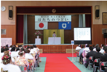
2017/1/9 第 68 回枚方市成人祭「はたちのつどい」(長尾西中学校) (枚方市)