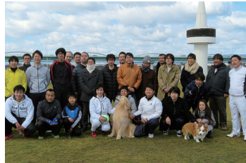
2017/2/19 枚方・交野の皆さんとふれあいサッカー (枚方市)