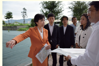
淀川渡河橋建設予定地および第二京阪側道渋滞スポットを現地視察

2016年8月大阪府が枚方高槻線で正式決定した淀川渡河橋。佐藤ゆかり議員は、30年来の市民の悲願を国に説得、道路調査費をつけ、1年5ヵ月で建設決定にもちこんだ政治手腕の持ち主です。平成27・28年度国の道路調査を経て、29年度から大阪府が調査設計段階へ。平成35年開通予定の八幡～高槻間新名神高速道路を睨んだ迅速な橋の建設は、今後大阪府の動き次第です。府の説得や橋の建設に伴う府道京都守口線拡幅事業への着実な国の支援にも佐藤ゆかり議員の力が必要です。