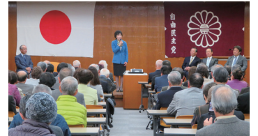
佐藤ゆかり大阪後援会ならびに自民党大阪11区 年次総会開催 平成 29年 3月 16日 (木)

たくさんの皆さまのご参加によりどちらも大変盛況に開催をさせていただきました。佐藤ゆかりの政治活動に対するご理解とご協力に心より感謝申し上げます。