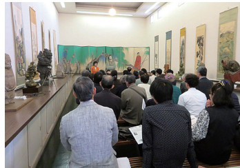
2017/4/9 天文美術館記念講演会ご挨拶 (枚方市)