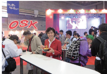
2017/4/29 「17食博覧会・大阪」視察 (大阪市)