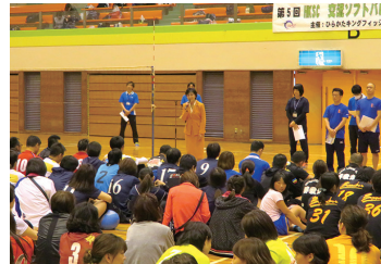
2017/5/3 HKSC交流ソフトバレーボール大会ご挨拶 (枚方市)