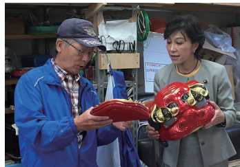
2017/5/22 枚方市に根ざした地域文化として菊人形を存続させていくボランティアの方々をご訪問 (枚方市)