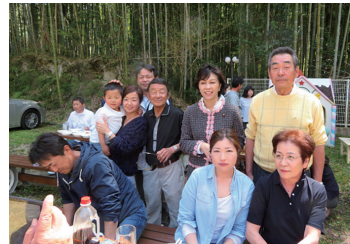
2017/4/16 毎年恒例たけのこ堀&BBQ (交野市)