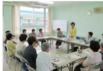
2017/5/27 お茶会に参加 (枚方市)