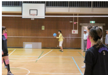
2017/5/7 桜丘校区区民球技大会 ソフトバレーに飛び入り参加 (枚方市)