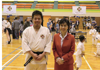
2017/4/29 春季枚方市少林寺拳法大会でご挨拶 (枚方市)