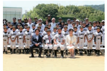
2018/6/17 2018年度枚方リトルリーグ卒団式に出席 (枚方市)