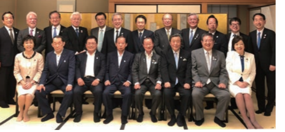
6/9 大阪万博誘致委員会の関西経済界幹部との懇談会出席