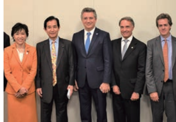
2018/5/15 アルゼンチン農産業大臣と日本・アルゼンチン友好議連役員との懇談会 (東京)