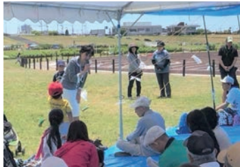
2018/5/20 磯島校区「歩こう会」にてご挨拶 (枚方市)