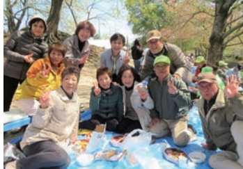
2018/4/8 第10回傍示川花見大会に参加 (交野市)