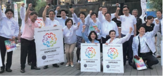
6/7 超党派大阪万博を実現する国会議員連盟で新橋にて街頭活動