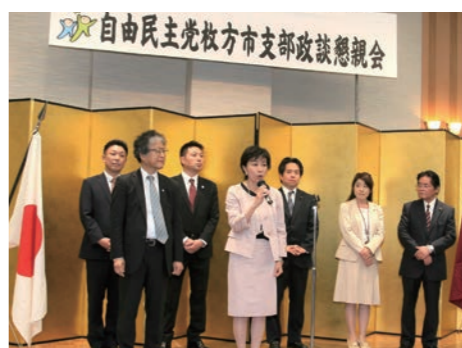
6/9 自民党枚方市支部政談懇親会にて統一地方選公認予定者ご紹介

来年の統一地方選挙に向けて、会場満杯の大勢のご参加者の見守るなか、自民党公認予定者の皆さんが勢揃いし壇上で紹介されました。与党に繋がる国・府・市の連携強化こそがいま枚方市に求められる政治課題です。自民党は国民民主党として、枚方市・交野市の市民の皆様の日常に寄り添い、責任政治を行なってまいります。