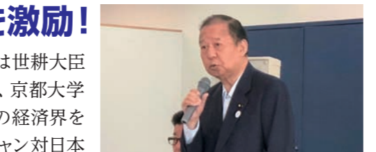
6/9 自民党大阪万博招致推進本部大阪総会での二階本部長ご挨拶