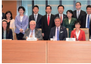
2018/4/6 第23回日米韓国会議員会議で安全保障を議論 (東京)