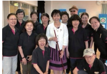
2018/5/26 第12回さだ若葉まつりスポーツ吹き矢に参加 (枚方市)