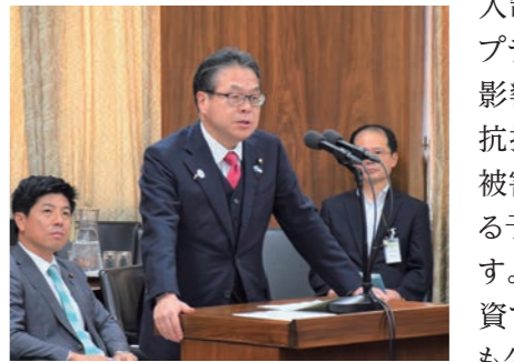
5/30 佐藤ゆかり議員の質疑に答弁する世耕経済産業大臣