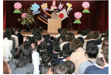
2018/4/7 菅原東校区の幼稚園入園式にてご挨拶 (枚方市)