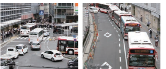
枚方市駅北口ロータリー混雑