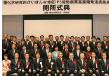
2018/4/9 理化学研究所けいはんな地区IPSCell開発拠点開所式典に参列 (木津川市)