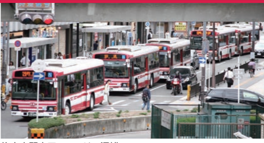
枚方市駅南口ロータリー混雑