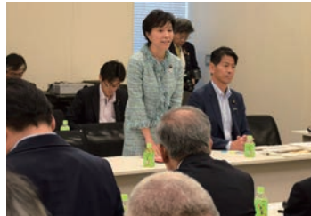
2018/6/13 中小・小規模事業者の円滑な世代交代を後押しする議連総会にて発言 (東京)